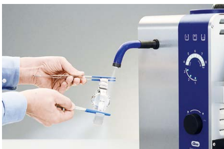
Reinigen mit fester Düse und Fußpedal Ermöglicht die Arbeit mit zwei Händen. Ideal für Uhrenbänder.