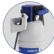
Filterkartusche Brita purity C150 Quell ST