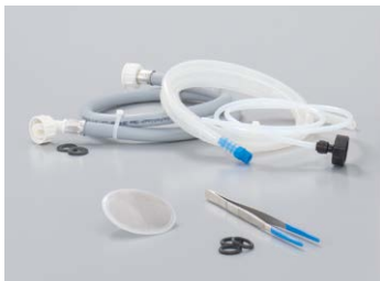
Pinzette · Sieb · Wartungsschlauch · Spülset · Ersatz-Tankverschluss

Als weiteres Zubehör und weitere Geräteoptionen: