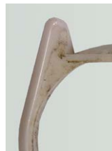
Abreinigen von Polierpaste