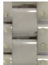
Abreinigen von Fett und Silikon