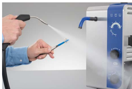
Reinigen mit flexiblem Handstück Reinigungsgut kann mit Dampfpinzette gehalten und schnell und effektiv abgestrahlt werden.