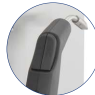
Druckluft (optionale Funktion)