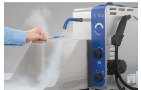
Reinigen in der Abdampfschale Feuchtigkeit und Verschmutzung werden in der Abdampfschale aufgefangen.