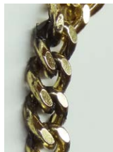
Abreinigen von Polierpaste