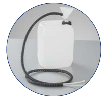
Kanister mit Füllstandsüberwachung

*3 Jahre Gewährleistung auf Elmasteam 8 basic bei sachgerechter Benutzung gemäß Bedienungsanleitung. Ausgenommen sind definierte Verschleißteile.