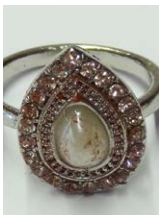
Abreinigen von Trageschmutz