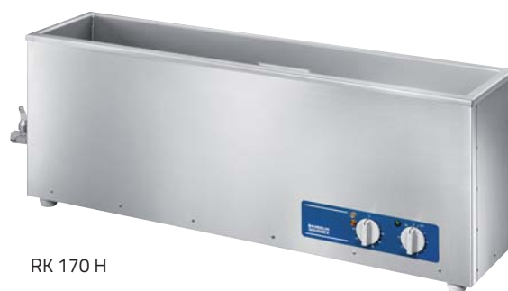
RK 170 H

Cuves à ultrasons de haute puissance pour nettoyage aux solutions de nettoyage aqueuses