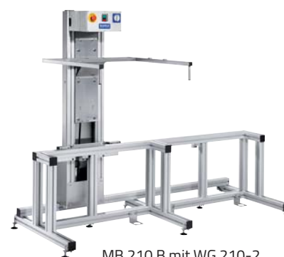
MB 210 B mit WG 210-2