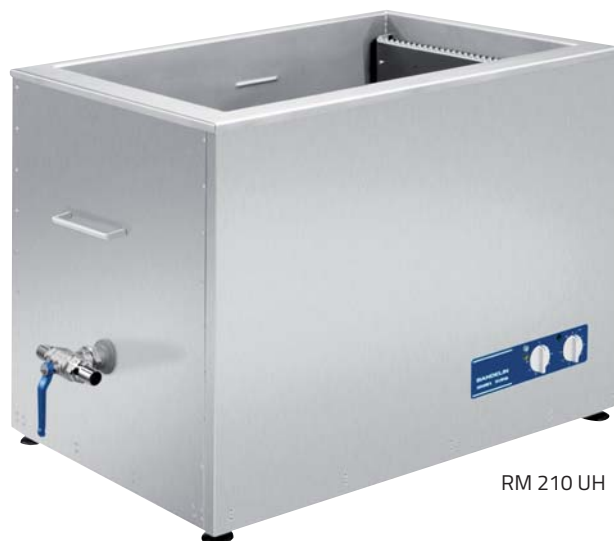
RM 210 UH