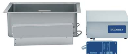
ZE 1059 DT