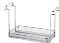
MK 40 S