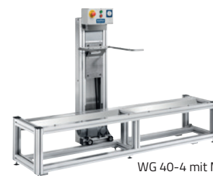
WG 40-4 mit MB 40