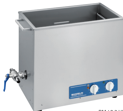
RM 40.2 UH