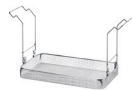
MK 40 B